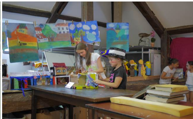
Výtvarně dramatický tábor

Příměstské tábory krajinomalby jsme opět nabídli ve dvou termínech: v červenci denní školu pro děti od 12 let a studující, a večerní pro dospělé a seniory, v srpnu opět pouze denní. Pro děti od 5 let byl určen výtvarně dramatický tábor. V posledním srpnovém týdnu jsme od pondělí do čtvrtka v odpoledních a večerních hodinách uspořádali čtyři jednorázové workshopy pro veřejnost, na kterých se podíleli čtyři lektoři, a předvedli jsme průřez naší nabídky: kresbu a malbu podle skutečnosti, základy figurální kresby, práci podle kopií mistrů a grafické techniky.