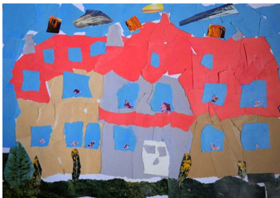
Břevnov očima malého umělce