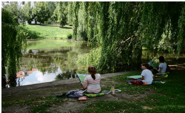
Letní škola 2017