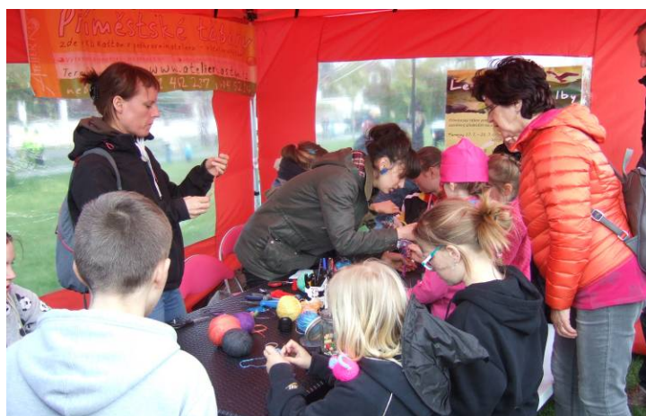
Čarodějnice Na Ladronce

Z toho důvodu pro nás tento půlrok představoval velmi intenzivní mimokursovou činnost, zaměřenou na upevnění povědomí o Ateliéru Kaštan a rozsahu naší nabídky volnočasových aktivit pro všechny věkové kategorie. Účastnili jsme se řady jednorázových workshopů, organizovaných jinými pořadateli: 22. 4. Den Země na Vypichu, 30. 4. Čarodějnice na Ladronce a 3. 6. Den dětí v KC Kaštan. Pouze sobotní jednorázové grafické dílny se uskutečňovaly v ateliéru, což je dáno nezbytností technického zázemí. Na konci června byla zkolaudována oprava střechy v KC Kaštan: ukončení školního roku proběhlo již v našich původních prostorách v podkroví.