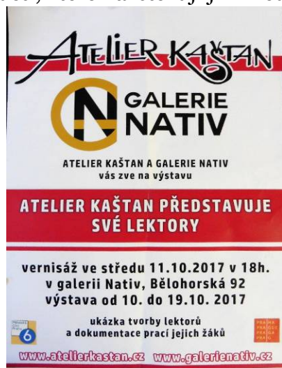
Plakát na výstavu v Galerii Nativ

V září v Galerii Nativ jsme prezentovali práce lektorů jako vodítko pro výběr kursů a v prosinci, s vernisáží během Vánočních trhů, jsme uvedli výstavu našich nových lektorek a dětí, které navštěvují jimi vedené kursy.